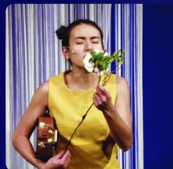
► Voir la bande-annonce

« Derrière cette magie théâtrale, poétique et enivrante se cache donc un vrai message de tolérance »