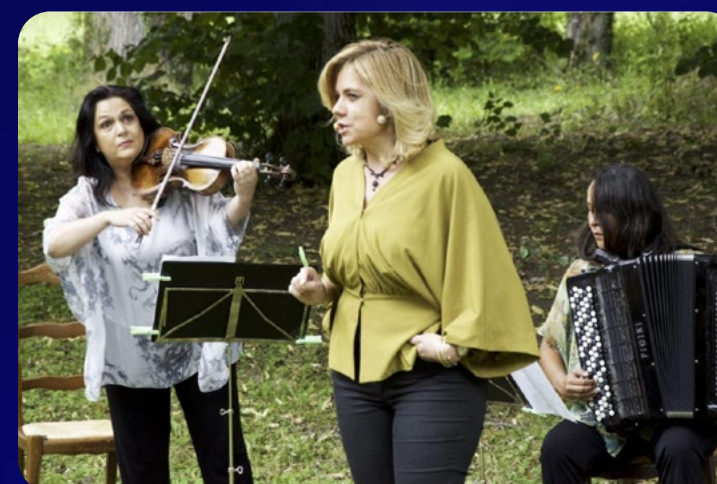
► Voir la bande-annonce