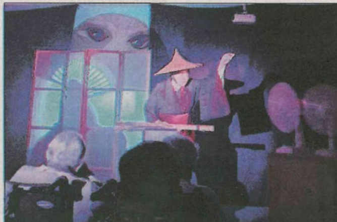
La fontaine de Miyajima, un voyage olfactif et poétique qui a emmené les résidents et leurs proches au Japon.